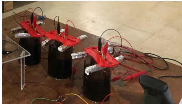
Gambar 1. Susunan alat pengujian dan pengukuran untuk konsentrasi 1M, 3M, dan 5M.